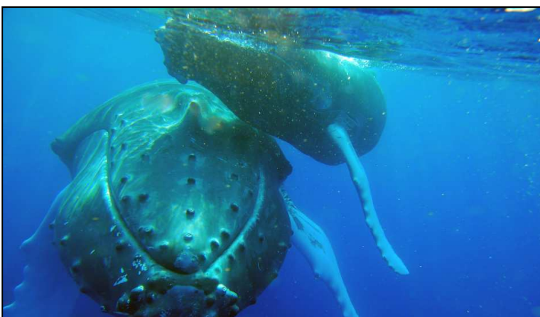
Légende : baleine à bosse ( Megaptera novaeangliae) et son jeune dans les eaux Guadeloupéennes.

Enfin, la visite de Paul Giacobbi lui permettra de rencontrer la partie de son équipe basée en Guadeloupe.